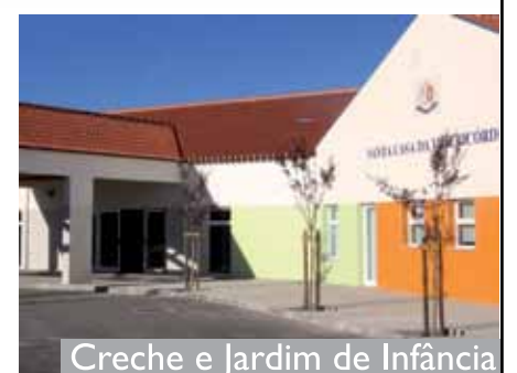
Creche e Jardim de Infância

A Santa Casa da Misericórdia de Idanha-a-Nova felicita o Ensino Magazine pelo seu 26º aniversário