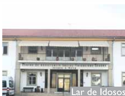
Lar de Idosos