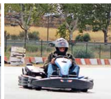
A I Corrida dos Reitores e Presidentes juntou várias dezenas de participantes

ciativa procura possibilitar a todos um justo momento de descontração”.